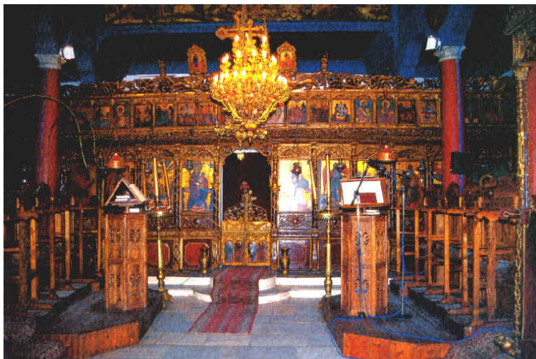
18. Το ξυλόγλυπτο εικονοστάσι του ναού της Κοίμησης της Θεοτόκου Χρονολόγηση: 1860 (βημόθυρο), 1861 (εικόνα Παναγίας Βρεφοκρατούσας)