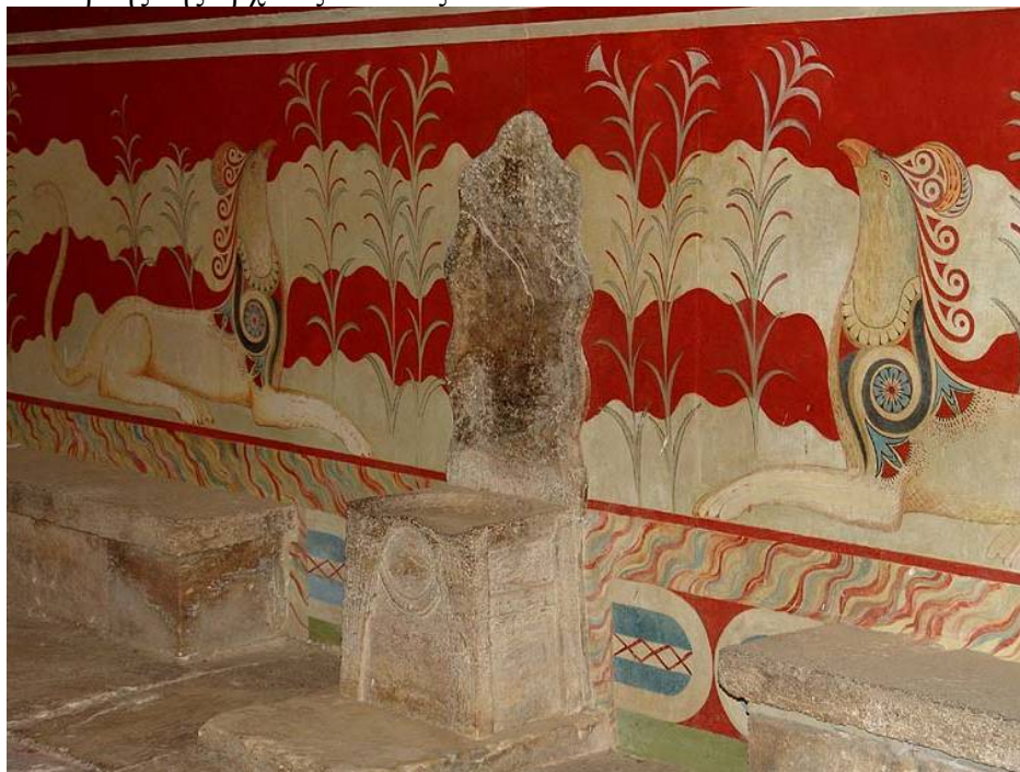
3. Η αίθουσα του θρόνου (μέσα 14ου αι. π.Χ.)