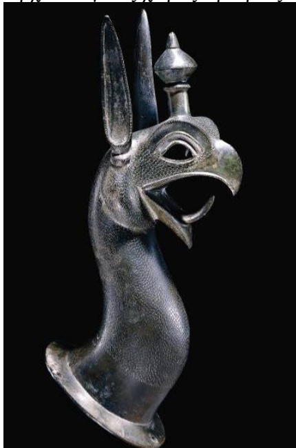
10. Εξάρτημα χάλκινου τρίποδα σε σχήμα κεφαλής Γρύπα