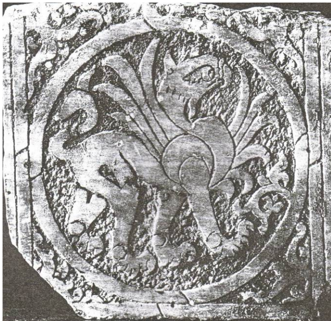
16. Μαρμάρινο ανάγλυφο θωράκιο τέμπλου με παράσταση Γρύπα Χρονολόγηση: β' μισό 13ου αι.μ.Χ. Προέλευση: πιθανότατα από την Αγία Θεοδώρα ή την Παναγία την Παρηγορήτισσα Άρτας Ύψος: 33 εκ. Πλάτος: 36 εκ.