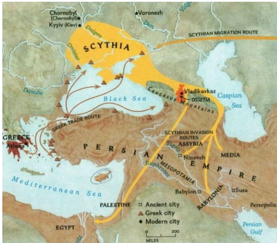
2. Χάρτης της αρχαίας Σκυθίας