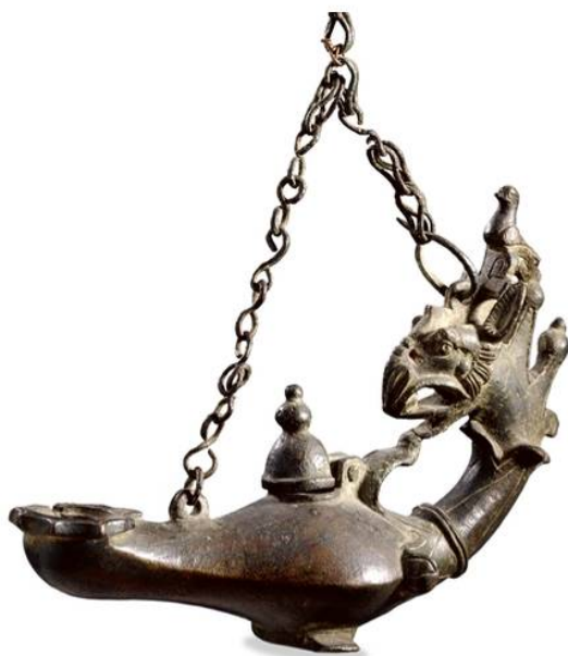
14. Βυζαντινό λυχνάρι από ορείχαλκο Χρονολόγηση: 5ος-6ος αι. μ.Χ. Προέλευση: Ερκολάνο (Ηρακλούπολη), Καμπανία, Ιταλία Μήκος: 21,300 εκ. Ύψος: 15,800 εκ. Πλάτος: 7,200 εκ. British Museum, London