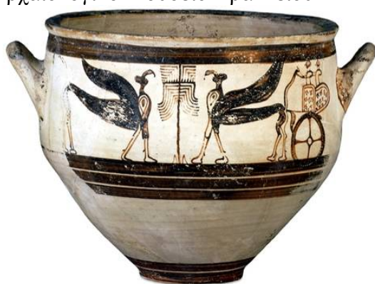
5. Μυκηναϊκό αγγείο με παράσταση Γρυπών Χρονολόγηση: 1300-1200 π.Χ. Προέλευση: Έγκωμη (τάφος αρ. 48) Ύψος: 24 εκ. Διάμετρος: 26 εκ. Αρ. εκθέματος: GR 1897.4-1.927 (Vases C 397) British Museum, London