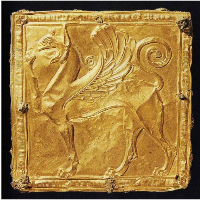
6. Χρυσό τετράγωνο έλασμα με έκτυπη παράσταση γρύπα. Πιθανώς επιστήθιο κόσμημα του χρυσελεφάντινου αγάλματος του Απόλλωνα.