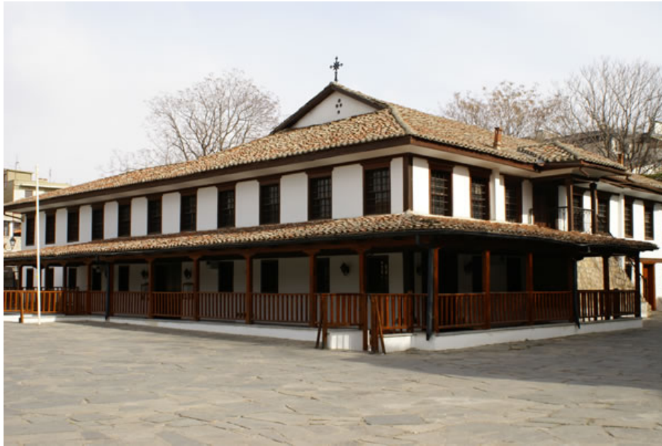
17. Ναός της Κοίμησης της Θεοτόκου, Κομοτηνή Χρονολόγηση: 1818 (ανέγερση ναού), 1859 (ανακαίνιση ναού)