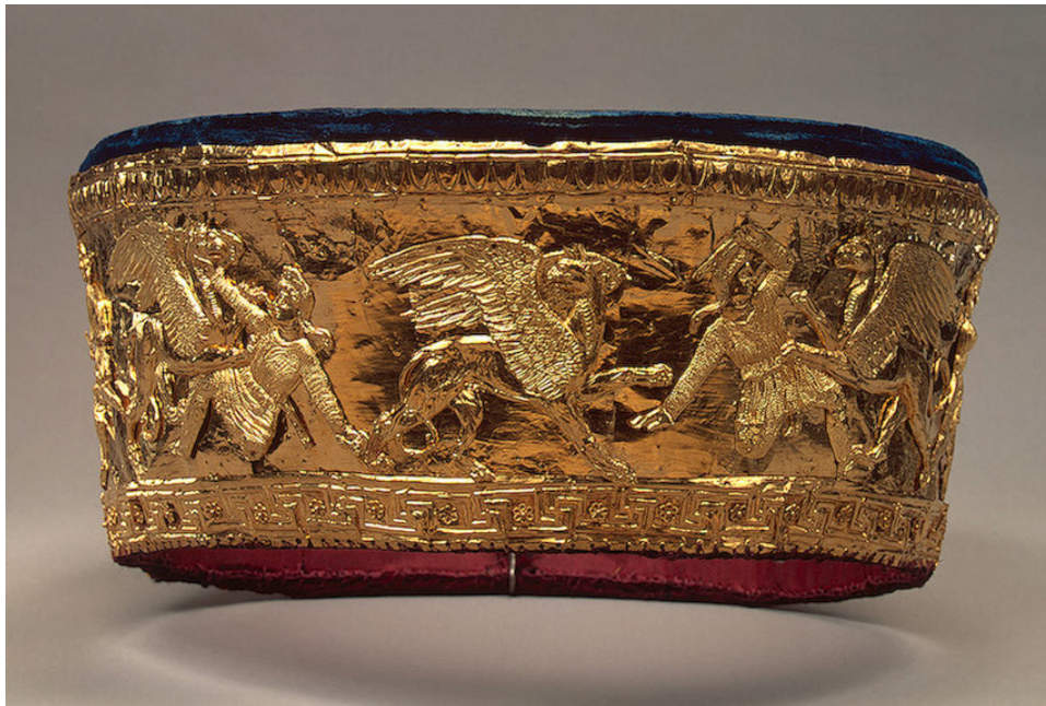
1. Χρυσός κάλαθος με παράσταση μάχης Αριμασπών με Γρύπες Χρονολόγηση: 330-300 π.Χ. Προέλευση: Ρωσία – Vyshestebliyevskaya (βόρειες ακτές του Ευξείνου Πόντου)