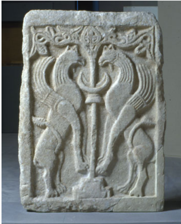
15. Βυζαντινό μαρμάρινο ανάγλυφο θωράκιο με παράσταση ζεύγους Γρυπών Χρονολόγηση: 10ος αι. μ.Χ. Βυζαντινό Μουσείο, Θεσσαλονίκη