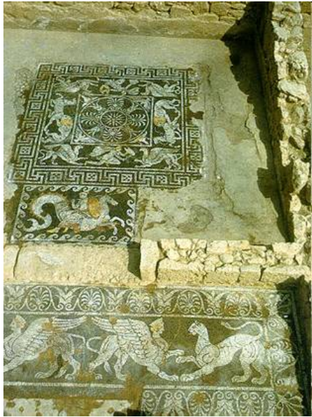
8. Ψηφιδωτό δάπεδο κατοικίας με παράσταση μάχης Αριμασπών και Γρυπών Χρονολόγηση: 370 π.Χ. Προέλευση: Ερέτρια Αρχαιολογικός χώρος Ερέτριας