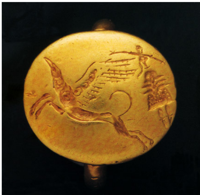
4. Χρυσό σφραγιστικό δακτυλίδι με παράσταση θεάς και γρύπα Χρονολόγηση: Ύστερη Εποχή του Χαλκού, 1450 - 1400 π.Χ. Προέλευση: Αρχάνες, Νεκροταφείο Φουρνί Διάμετρος: 0,01 μ. Αρ. εκθέματος: ΑΕ 1017 Αρχαιολογικό Μουσείο Ηρακλείου