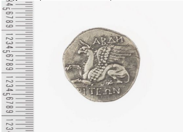
7. Ασημένιο Τετράδραχμο με παράσταση Γρύπα