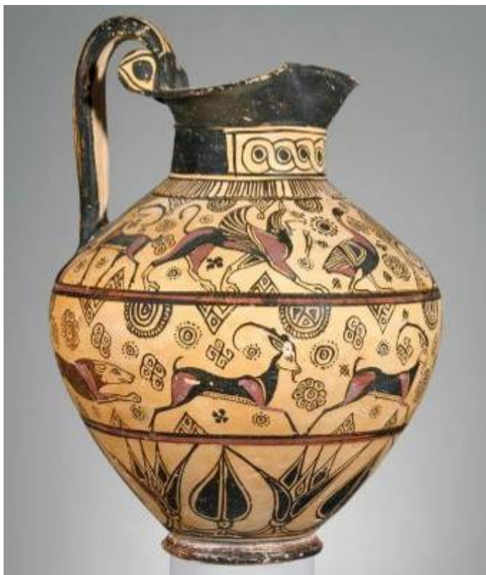
13. Μελανόμορφη οinoχόη με παράσταση Γρύπα Χρονολόγηση: 620–580 π.Χ. Προέλευση: Μίλητος Ύψος: 31 εκ. Αρ. εκθέματος: 03.90 Museum of Fine Arts, Boston (MA)