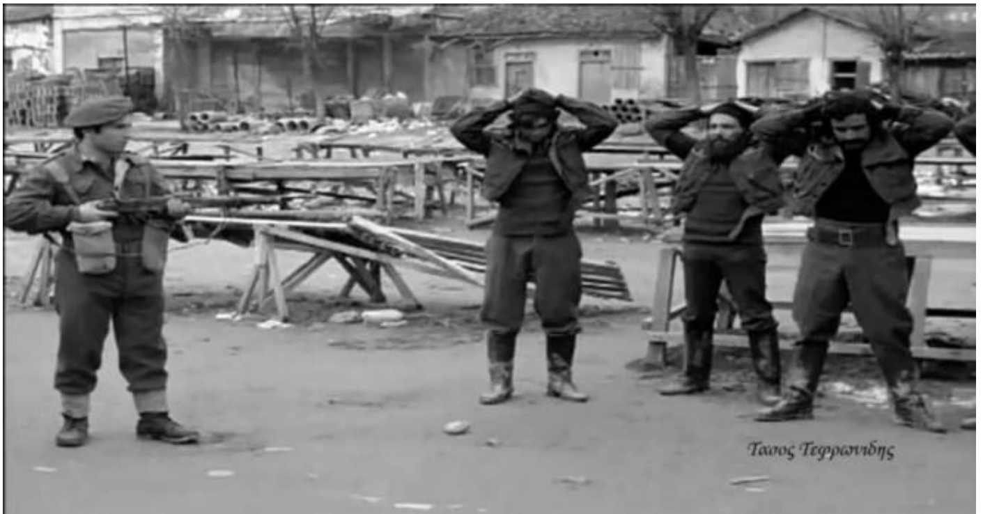
3) Γύρισμα στο παζάρι, μπροστά στους πάγκους