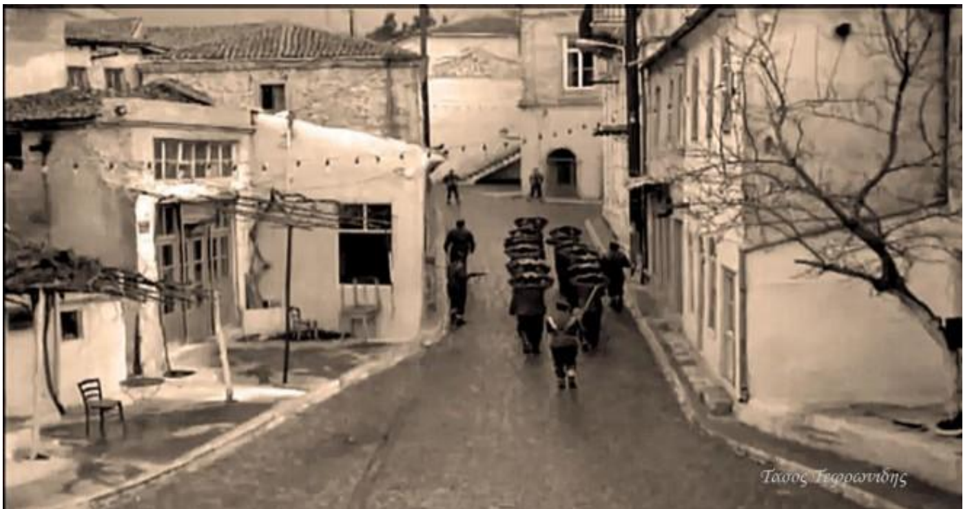
4) Γύρισμα με ομάδα αιχμαλώτων που περιφέρονται. Ανεβαίνει την οδό Ορφέως από την πλατεία Αντίκα προς το Δημαρχείο.