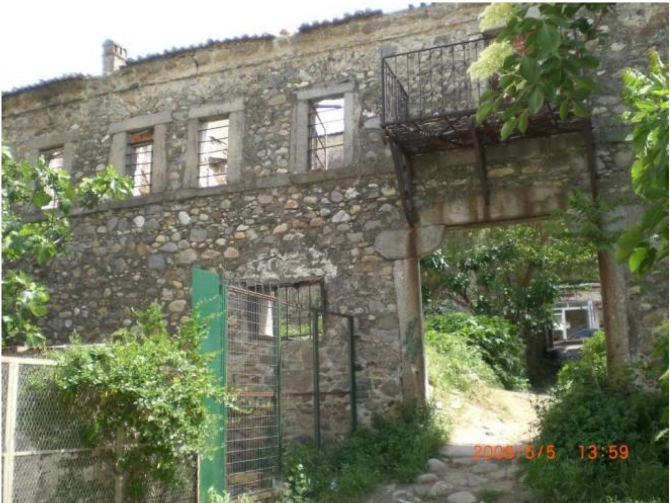
5) Λεπτομέρεια από την «πύλη» στο χάνι του «Μαργαρίτη»