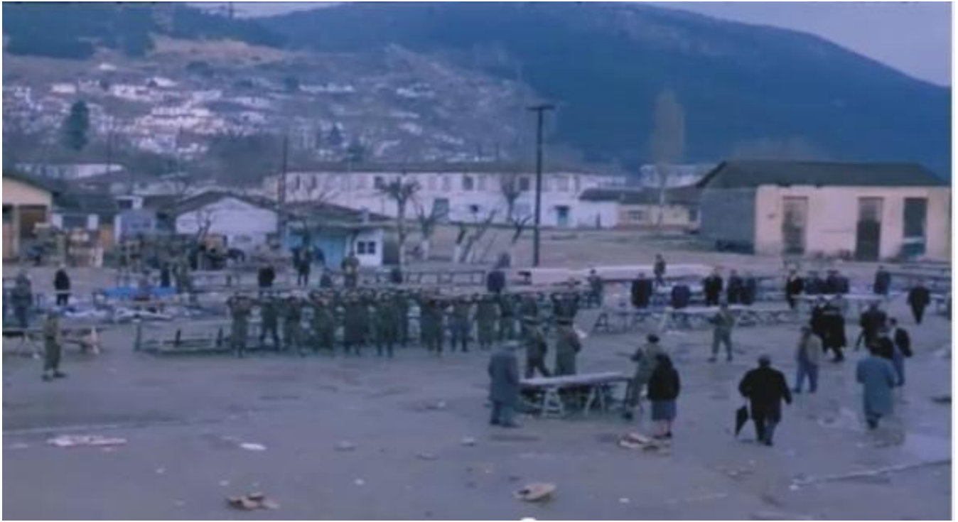
7-8) Σκηνές από την ταινία, στο Παζάρι και στην Πλατεία Αντίκα