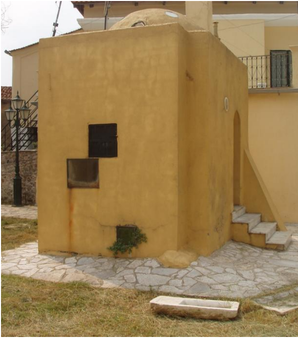
Χαμάμ ανδρών Men hamam