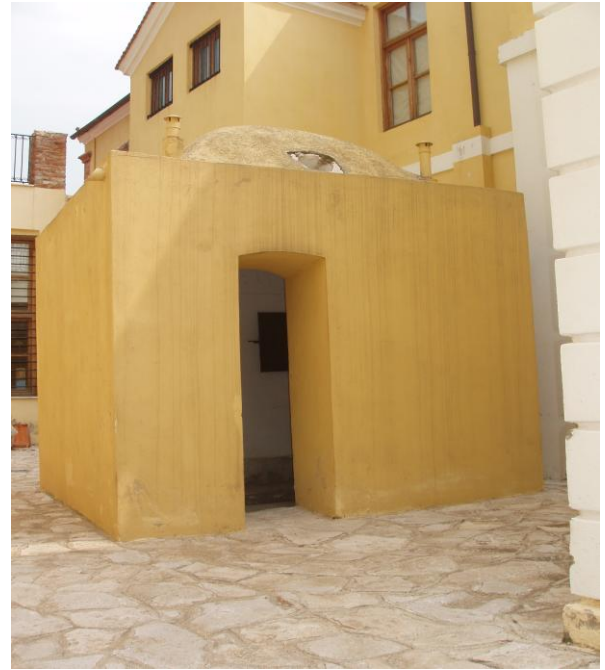
Χαμάμ γυναικών Women hamam