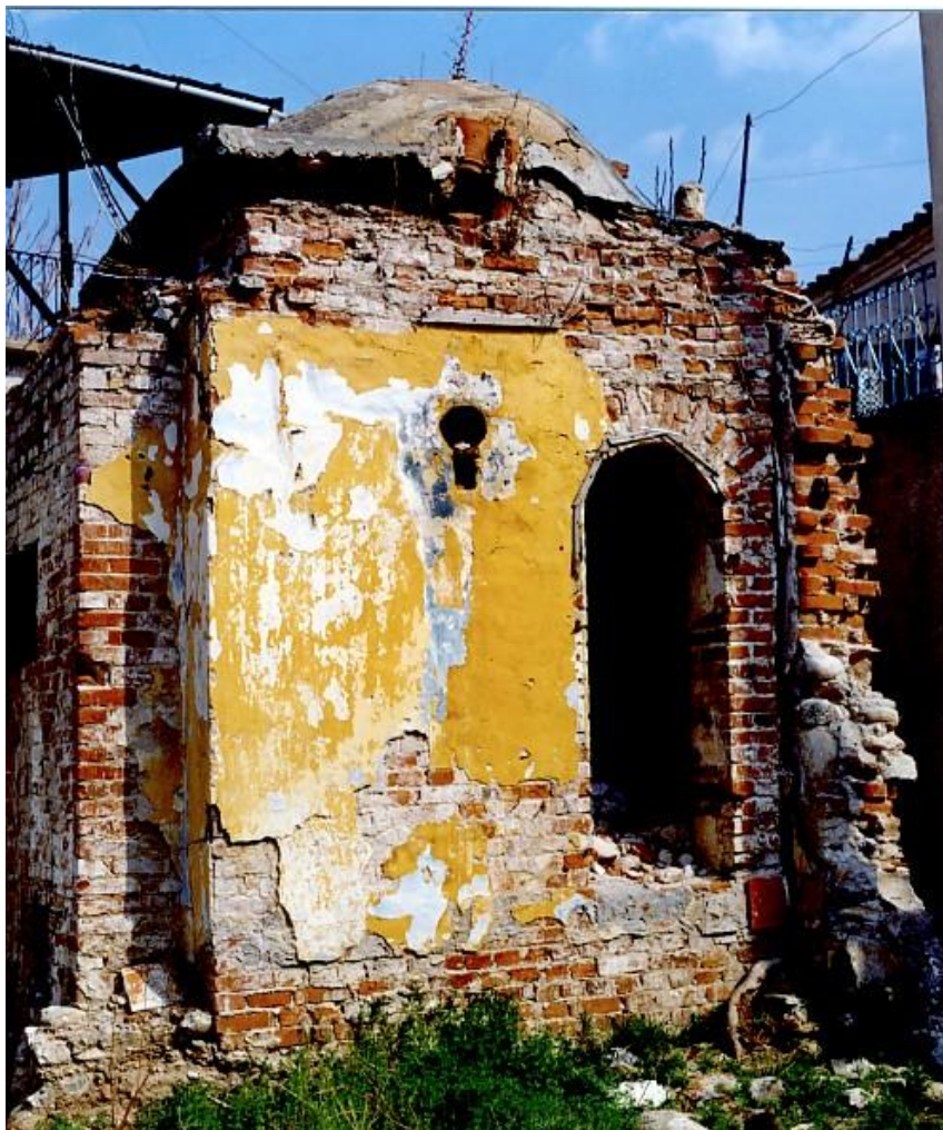
Το χαμάμ πριν την αποκατάσταση - The hamam before the conservation

With support from the Stavros Niarchos Foundation