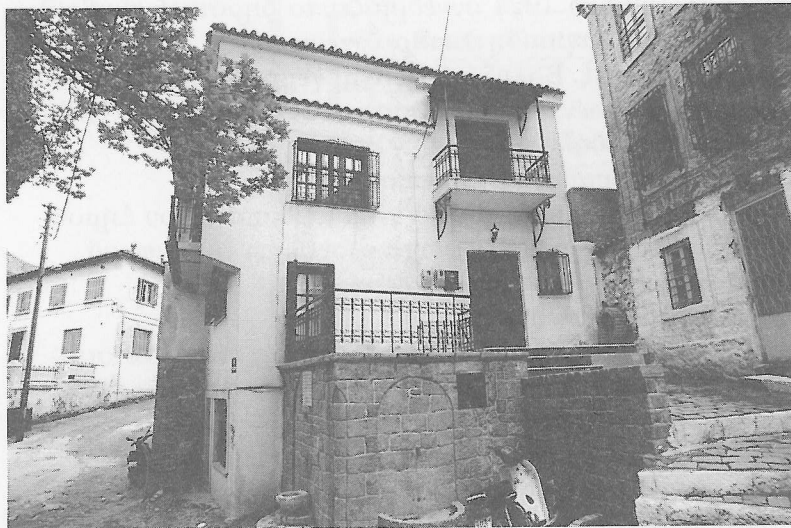
Το σπίτι και η βρύση των Μαυρομιχαλαίων, οδός Μαυρομιχάλη, αριθ. 24.