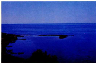
4. Το τείχος του 4ου αι. π.Χ. είχε κατά διαστήματα πύργους, σε πυκνότερη 5. Το λιμάνι. Ένας λιμενοβραχίονας ξεκινάει από την Α. ακρή του όρμου. Διόταξη στα πεδία μέρη που ήταν πιο ευπρόσθλιτα.

όπου ήδη οι τέχνες γνώριζαν μεγάλη άνθηση, θά έφεραν μαζί τους μίαν αναπτυσσόμενη καλλιτεχνική παράδοση. Άψευδείς και μόνον μάρτυρες τά όμορφα νομίσματά τους που από τό τέλος του 6ου αι. π.Χ. δίνουν μιά ιδέα του επίπεδου τής τέχνης τους, αλλά και τής ήδη αναπτυσσόμενης οικονομικής ζωής. Ή μόνη ιστορική πληροφορία που έχουμε γιά τήν πόλη τήν περίοδο αυτή είναι ή διαμάχη τής μέ τή Θάσο στά μέσα του 7ου αι. π.Χ. γιά τήν κατοχή τής άποικίας τών Θασίων Στρώμης. Όπως φαίνεται, στήν περίοδο τών περσικών πολέμων, ή Μαρώνεια άκολούθησε τήν τύχη τών άλλων ελληνικών πόλεων τής Θράκης και ύποτάχτηκε στούς Πέρσες. Ό Ήρώ-