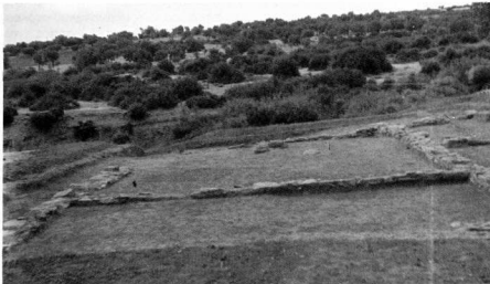
10. Ένας πλατύς πρόδρομος με σηκό και έστια μαζί με συμπληρωματικούς χώρους συγκροτούν μία μορφή ενός τυπικού έπαρχιακού ιερού του 4ου αι. π.Χ.