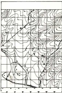
6. Τοπογραφία τής κάτω πόλης. 1. αναλημματικοί τοίχοι, 2. θέατρο, 3. ιερό, 4. σπιτια, 5. μνημειακή είσοδος, 6. λιμάνι.

σημαντικότερες και πλουσιότερες πόλεις τής Θράκης. Γύρω στά μέσα του 5ου αι. π.Χ. οι βασιλείς τών Θρακών Όδρυσών Τήρης και ό γιός του Σιτάλκης, ύποτάσσοντας τά θρακικά φύλα τής περιοχής, ίδρυσαν ισχυρό βασίλειο που περιλάμβανε τμήμα τής Άνατ. Μακεδονίας μέχρι τό Στρωμόνα, τή Θράκη μέχρι τό Βυζάντιο και τή σημ. Βουλγαρία. Δέν είναι έξακριβωμένο άν ή Μαρώνεια, όπως οι άλλες ελληνικές πόλεις τών παραλίων, αναγκάστηκε νά πληρώνει φόρο στούς Όδρυσές βασιλείς. Ένα είναι βέβαιο, ότι είχε στενές σχέσεις μαζί τους όπως δείχνουν τά νομίσματα τών Όδρυσών που είτε κόπηκαν στό νομισματοκοπείο τής Μαρώνειας, ει-