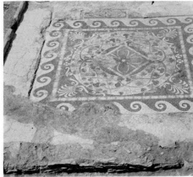
11. Ψηφιδωτός διακόσμος του δαπέδου ενός σπιτιού των αρχών του 3ου αι. π.Χ.

τω. Τό 350 π.Χ. θέτει τέρμα στην ανεξαρτησία της πόλης και την προσαρτά στο βασιλείο του. Τότε σταματάει και η κυκλοφορία των αυτόνομων χρυσών (είχαν άρχισει να κυκλοφορούν τό α' μισό του 4ου αι. π.Χ.) και άσημένιων νομισμάτων. Μία σειρά από 28 άσημένα τετράδραχμα του α' μισού του 4ου αι. π.Χ. είναι έκτεθειμένα στο Νομισματικό Μουσείο. Έπιτρέπουν στη Μαρώνεια να κόβει μόνο μικρά χάλκινα νομίσματα για τίς έσωτερικές της ανάγκες.