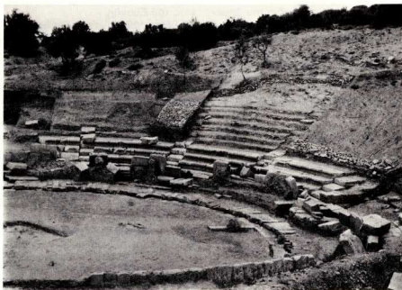
7. Στήν τοποθεσία «Καμμένα» ήταν γνωστή, από τό 1905, ή θέση του άρχαιου θεάτρου.