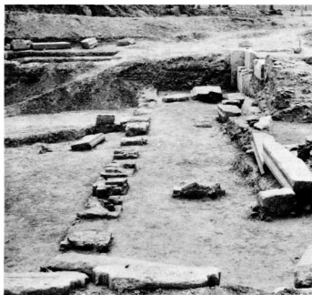
8. Η ακμή των ρωμαϊκών χρόνων δεν έχει αποκαλυφθεί ακόμα ολόκληρη.

Την περίοδο αυτή οι Άθηναίοι παίρνουν το ρόλο του ρυθμιστή στις τύψεις των ελληνικών πόλεων των θρακικών παραλίων. Το 337 π.Χ., σε μία σύγκρουση των Μαρωνιτών με τους Άδθηρίτες παρεμβαίνει ο Άθηναίος στρατηγός Χαθρίας. Το 361 π.Χ. οι Μαρωνίτες καταλαμβάνουν τη Στρώμη, αλλά την έπομένη χρονιά η μητρόπολη της τελευταίας, η Θάσος, με τη θήβεια των Άθηναίων την ξαναπαίρνει. Στα μέσα του 4ου αι. εμφανίζεται στην περιοχή μία άλλη μεγάλη δύναμη οι Μακεδόνας, που με τον Φίλιππο Β' επέκτεινουν όλοένα τα όρια της κυριαρχίας τους. Την άνοιξη του 353 ο Φίλιππος έπετέθη στη Μαρωνεία αλλά δεν κατόρθωσε να την καταλάβει γιατί συνάντησε μεγάλη αντίσταση από το σύμμαχο της πόλης, τον Θράκα ηγεμόνα Άμαδοκο, που ήταν κύριος της περιοχής ανάμεσα στον Έβρο και το Νέστο. Κινδύνευσε μάλιστα κι από τον αθηναϊκό στόλο. Όμως ο Φίλιππος δεν το βάζει κά-