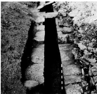
9. Ένας άγωγός βάθους 1 μ. και πλάτους 0,50 μ. συγκέντρωνε τα νερά του χερσαίου που μέσω του άγωγού της άρχιπυλῆς χύνονταν πίσω από τη σκηνή, όπου συνεχιζόταν ο άγωγός.