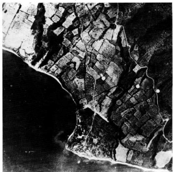
2. Αεροφωτογραφία της περιοχής της αρχαίας Μαρωνείας. Διακρίνεται ο λιμενοβραχίονας.

πλευρό των συμμάχων τους Τρώων κατά των Ελλήνων.