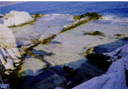
Μέρος λατομείου καλυμμένο ἀπό τά νερά τήσ θάλασσας.