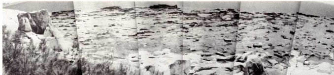
Άλικη Θάσου. Τά λατομεία έχουν σκεπαστεί από τή θάλασσα.

Ἡ Θάσος, ἐκτός ἀπό τά καλά τήσ κρασιά ἦταν γνωστή στήν ἀρχαιότητα καί γιά τά λευκά τήσ μάρμαρα.