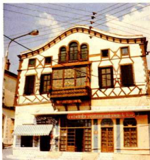
Παλιό άρχοντο στο Ν.Δ. όριο της διατηρητέας ζώνης.

Θά πρέπει, επίσης, ν' άναφέρουμε μιάν άλλη ιδιαιτερότητα της πόλης της Ξάνθης, τό ότι ύπηρεε δηλαδή έστία ισραηλιτικής κοινότητας μέχρι τόν δεύτερο Παγκόσμιο Πόλεμο, για τήν όποια και λείπουν έντελώς τά σχετικά στοιχεία. Μιά πέμπτη, λοι-