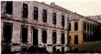
Καπιναποθήκες στην Ξάνθη.