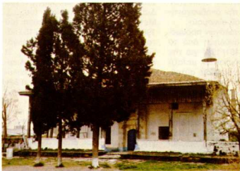
Τὸ τζαμί τῆσ Γενεσίας.

Τὸ θέμα ἢ μάλλον ἡ περιπέτεια τῆσ προστασίας τῆσ παλῆασ Ξάνθης δόθηκε πολὺ εὐχλωπτα ἀπὸ τὸν Εὐάγγ. Πεντάζο 4 . Ἡ διαφύλαξη τοῦ τμήματοσ τοῦ, τελικά διασώθηκε ἀποτελεῖ ἄλλο ἕνα τίτλο τιμῆσ τῶν Ἑλλήνων