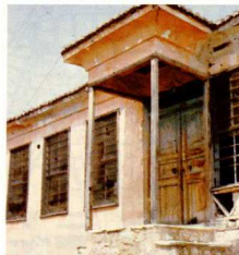
Ή είσοδος του παλιού μουσουλμανικού σχολείου στην Παλαιά Χρυσά.