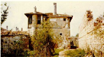
Αρχοντικό στην Παλαιά Χρύσσα.