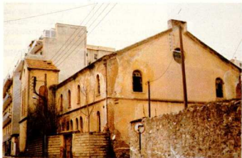
Η παλιά συναγωγή.