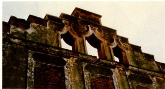
Καπναποθήκες στην Ξάνθη.

ἀρχαιολόγων και εικονίζει πολύ παραστατικά τόν άγώνα τους, παρά τις πιέσεις συμφερόντων, «παράγοντων» και τοπικών βουλευτών. Ή «πολιτική» των τελευταίων υπήρξε Εξακθάρη: καταστροφή τών πάντων. Και ή τακτική του κράτους χαρακτηρίστηκε από τήν κλασική, πιά, άνορηξία, συνδυασμένη μέ σειρά παλινωδίων. Σταθίσαμε εδώ τούς κυριότερους σταθμούς τής τακτικής αυτής.