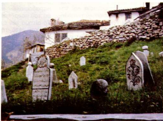
Μουσουλμανικό νεκροταφεῖο στὸ Ἴβραιο.