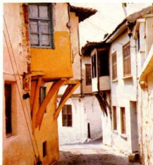
Σπίτια στη διατηρητέα περιοχή του φηάχτηκαν από καστοριανούς τεχνίτες.