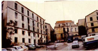
«Συναϊκία» - καπιναποθηκών στην Καβάλα.

στανίτη και Καλό Νερό), αλλά ή δλη «όργανωση» και επίβλεψη παροχής οικοδομικών αδείων και έργων, όπως και το κόστος τους αποτελούν παράγοντες απαγορευτικούς για σωστές επισκευές ή κατασκευές παραδοσιακών κτιρίων.