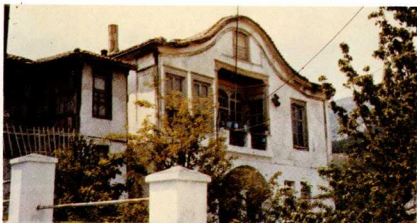
Παλιό μουσουλμανικό αρχοντικό στην πόλη τῆς Ξάνθης.

πόν, ἔθνια ἄλλοτε, τῆς ὁποίας πολιτιστικό ἶχνοσ βασικῆσ σηματοῖασ ἀποτελεῖ τὸ κτίριο τῆσ Συναγωγῆσ, πού πρῖν μερικά χρόνια εἶχε χρησιμοποιοθεῖ καὶ ὡσ θεατρική στέγη. Σῆμερα, ἐρειπωμένο, κηρύχθηκε, εὐτυχῶσ, διατηρητέο μνημεῖο καὶ ἐλπίζεται ὅτι σύντομα θά ἀξιοποιοθεῖ ὠστά.