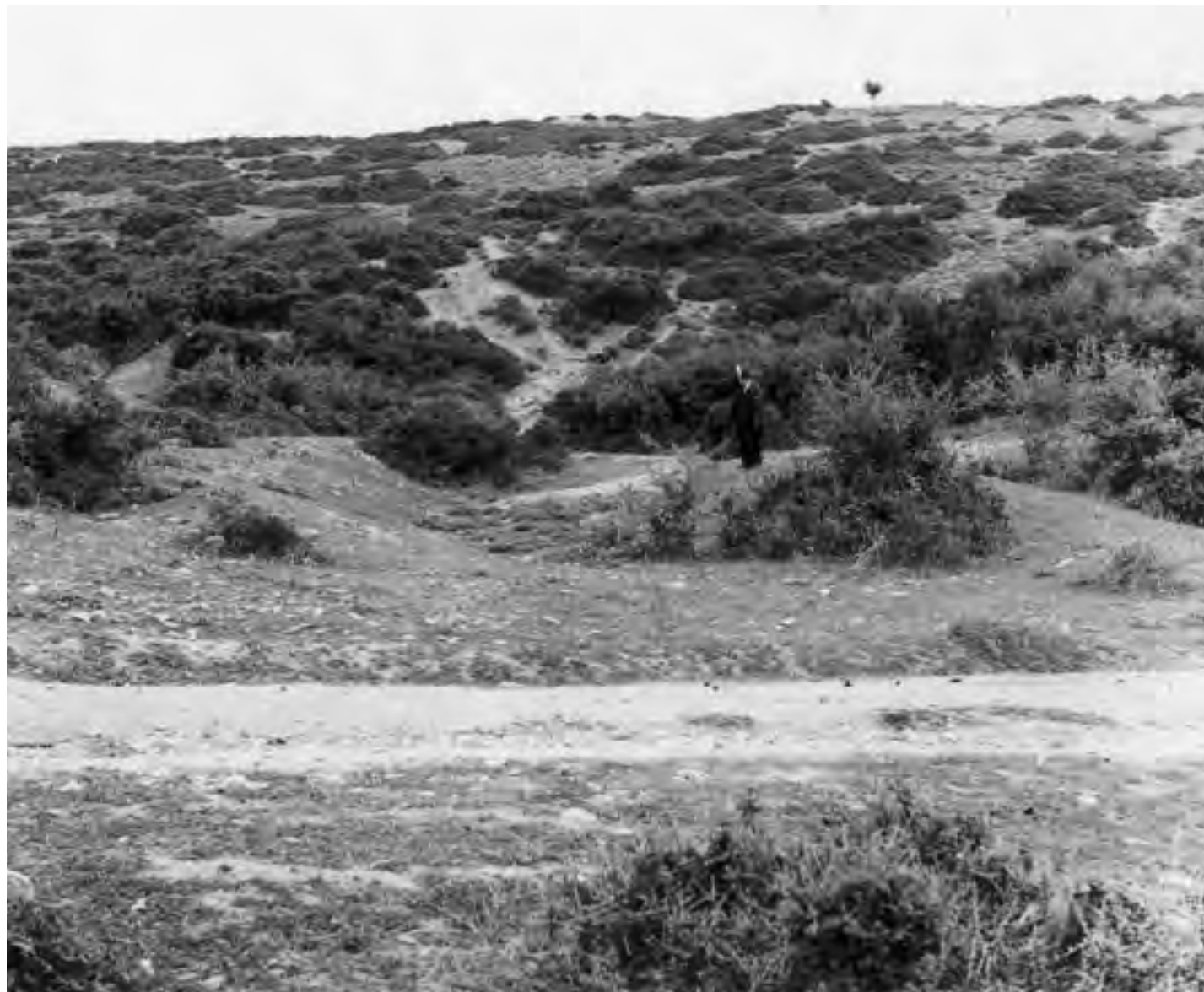
Ο χώρος του Αρχαίου Θεάτρου της Μαρώνειας πριν την ανασκαφή. Όπως και η φωτογραφία του 1969 δείχνει δεν ήταν ορατό κάποιο από τα τμήματα του Θεάτρου

Χ.Κ.: Όχι, μεσολάβησε η Σαμοθράκη, που είναι ένας πολύ αγαπημένος μου τόπος,