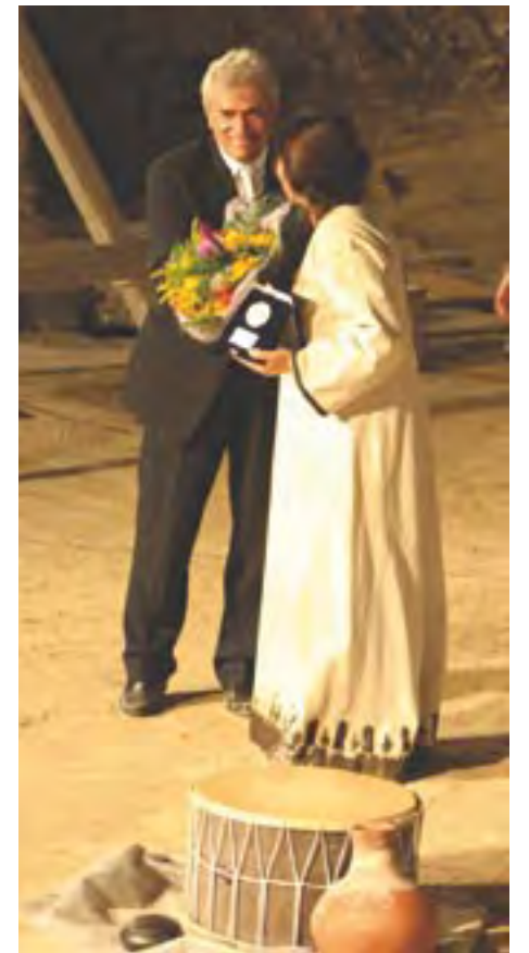
Η πρωταγωνίστρια της βραδιάς παραλαμβάνει το αναμνηστικό από το δήμαρχο Μαρώνειας