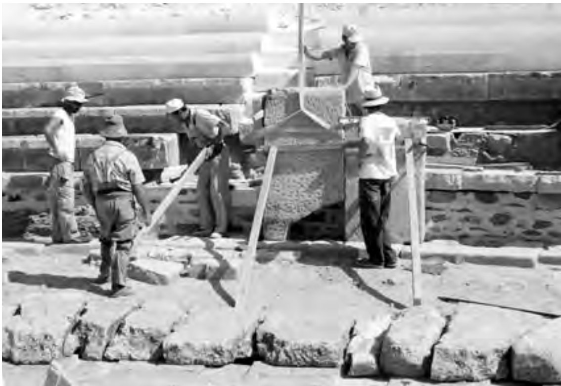
2008. Εργασίες αναστήλωσης