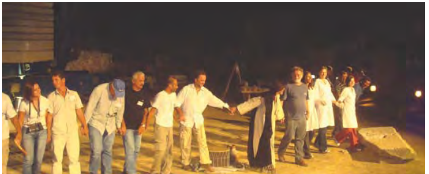
Ένα θερμό χειροκρότημα για όλους τους συντελεστές