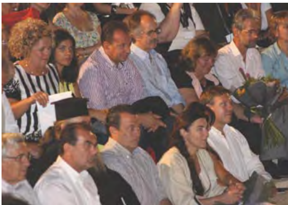
Η τραγωδία ανάμεσα στους κ.κ. Στυλιανίδη και Πεταλωτή με το πέρας της παράστασης, ενώ διακρίνονται οι κκ. Γιαννακίδης και Μινόπουλος

Ο υπουργός Μεταφορών Ευριπίδης Στυλιανίδης μίλησε αρχικά συναισθηματικά και στη συνέχεια πολιτικά. «Θα μπορούσα να κληθώ σε δύο ρέξεις τα συναισθήματα της ιδιαίτερης αποψινής βραδιάς, οι ρέξεις που θα επέλεγα είναι συγκίνηση και περηφάνια. Συγκίνηση διότι τα μάρμαρα της Μαρώνας χάρη στην επίσημη και μακροχρόνια δουλειά των αρχαιολόγων και την υπέροχη αποψινή παρουσία της Λυδίας Κονιόρδου και των συνεργατών της, πήραν ζωή, απέκτησαν φωνή και μίλησαν απόψε και θα μιλούν και στο εξής και θα ακούγονται από όλο τον ελληνισμό, αλλά και από την υφήλιο, αποδεικνύοντας εμπράκτως μέσα από αυτό το θέατρο την διαχρονική παρουσία του ελληνισμού στην Θράκη, αλλά και την διαχρονική συμβολή της Θράκης στην εθνική ιστορία και τον παγκόσμιο πολιτισμό. Την δεκαετία το '80 είχα την τύχη να επισκεφθώ το μέρος αυτό, συνοδεύοντας τον τότε υποψήφιο βουλευτή Θεσσαλονίκης Κώστα Καραμανλή. Πηδήξαμε κάποια σύρματα, δίπλα μας ήταν μόνο οι αρχαιολόγοι που επέμεναν διαχρονικά στην ανάδειξη αυτού του έργου, και ο τότε πρόεδρος Κοινότητας Μαρώνας, ο αείμνηστος Μαργαρίτης. Επανήλθαμε στο σημείο την δεκαετία του '90 όταν και ο Κώστας Καραμανλής επέμενε ότι θα πρέπει μέσα από αυτό το έργο να δείξουμε αυτό-