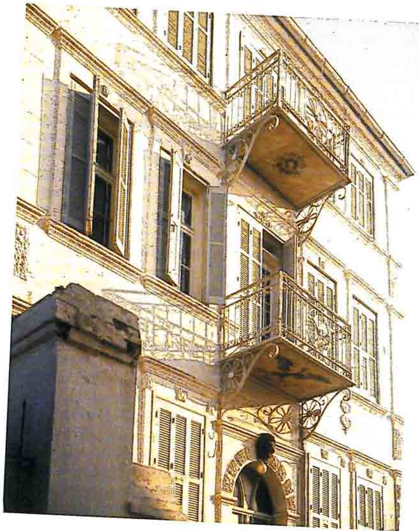
Παλιά Ξάνθη: Το αρχοντικό Μεταξά σε νεοκλασικό ύφος με λόγια στοιχεία και ζωγραφικό διάκοσμο. Η κτητορική επιγραφή χρονολογεί το κτήριο το 1900.

Ο Δεύτερος Παγκόσμιος Πόλεμος και τα τραγικά γεγονότα του Εμφυλίου απετέλεσαν την αιτία της οικοδομικής απραξίας. Η Δεύτερη Βουλγαρική Κατοχή και ο φόβος των διαγμών και της κακομεταχείρισης από τους κατακτητές είχαν ως συνέπεια να μετακινηθούν πολλές και αξιόλογες αστικές οικογένειες της Ξάνθης προς την Θεσσαλονίκη και την Αθήνα, αφήνοντας κλειστά και κενά τα ακίνητά τους