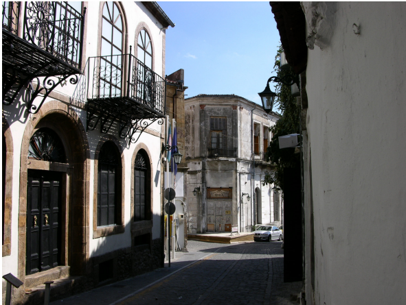
Φωτ. Χαρακτηριστική διασταύρωση στη Παλιά Πόλη της Ξάνθης.

Στην κατηγορία των εμπορικών κτηρίων εντάσσονται τα καταστήματα, τα εργαστήρια, και οι χώροι αναψυχής και κοινωνικών συναθροίσεων. Τα κτήρια αυτά έχουν ιδιαίτερα μορφολογικά στοιχεία που καθορίζονται από τη χρήση τους (είσοδος-έξοδος των πελατών, μεγάλα ανοίγματα – βιτρίνα στην όψη, κλπ) καθώς και γενικότερα από τη λειτουργία του χώρου (αποθήκη, εργαστήρια, κ.α.). Τα καταστήματα είναι εύκολα αναγνωρίσιμα με το χαρακτηριστικό λεπτό