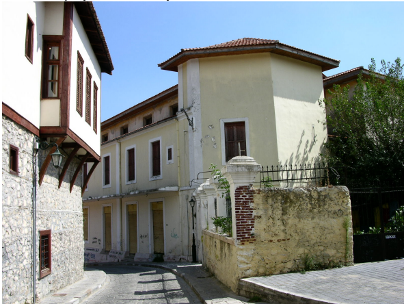
Φωτ. Η διάσπαση του προεξέχοντος όγκου των σαχνισιών σε επίπεδα με τη χρήση διακοσμητικών ξύλινων στοιχείων στις ακμές

Ιδιαίτερο διακοσμητικό στοιχείο των σαχνισιών είναι η τοποθέτηση στις ακμές τους ξύλινων κιονίσκων στους οποίους παρατηρείται τριμερής διαίρεση: βάση, κορμός και στέψη. Οι κίονες αυτοί τοποθετούνται στις ακμές των προεξοχών και συνδέονται οριζόντια στη βάση της προεξοχής. Το ύψος τους σταματά λίγο πριν από τη στέγη, όπου υπάρχει και διακοσμητικό επίκρανο.