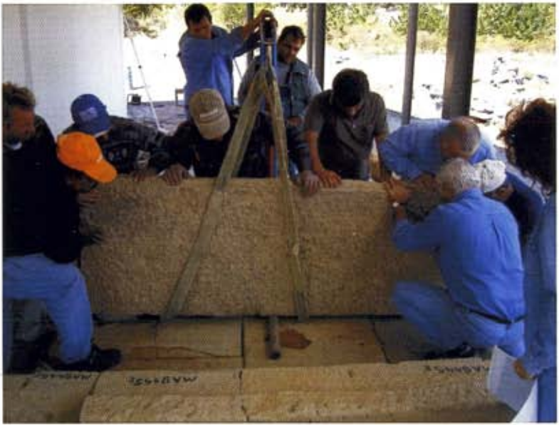
Εργασίες για τη συναρμολόγηση του τάφου του .. λόγιου πολεμιστή