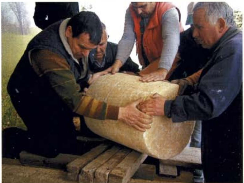
Μεταφορά επιτύμβιου κιονίσκου