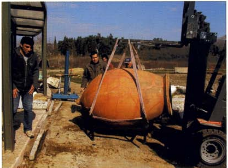
Τοποθέτηση του ταφικού πιθαριού