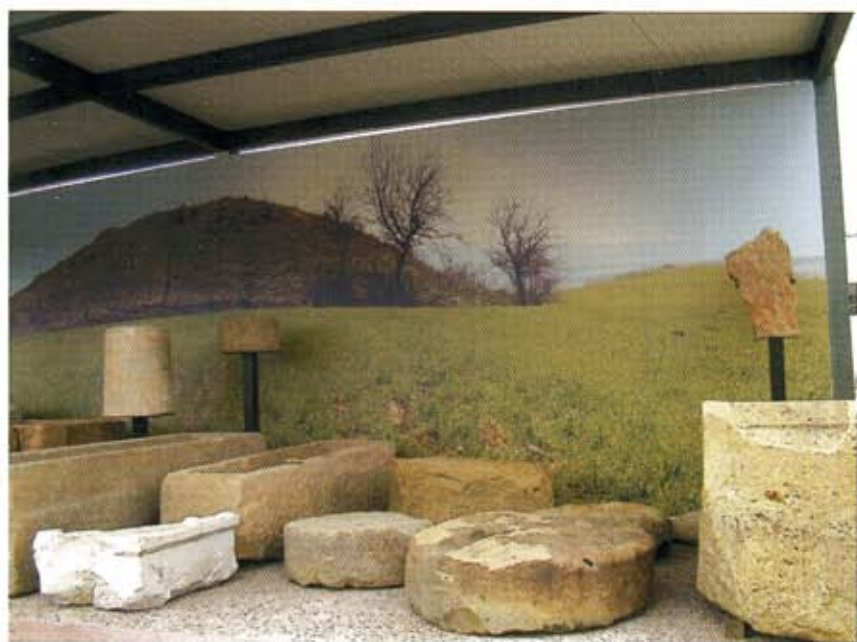
Τμήμα της έκθεσης. Επιτύμβιες στήλες, κιονίσκοι και σαρκοφάγοι