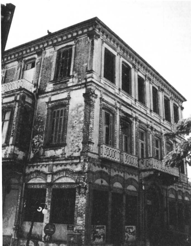
Το Μεγάλο Σπίτι (Grade Mezone) στην οδό Χρύσης.

Η εφημερίδα «Φωνή της Ξάνθης» και η Θρακική Θεατρική Σκηνή, καλούν το Μάνο Χατζιδάκη για δύο συναυλίες στις 28.10.1978 ημέρα Σάββατο και 29.10.1978 ημέρα Κυριακή.