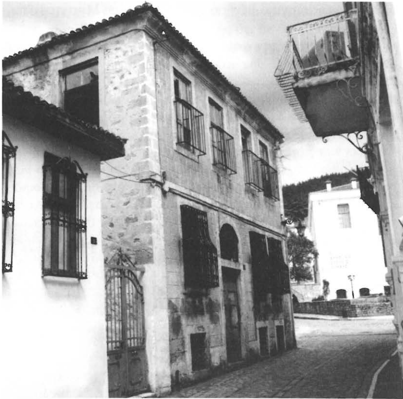
Σπίτι οδού Αντίκα αριθ.11 (το διώροφο κτίριο αριστερά)