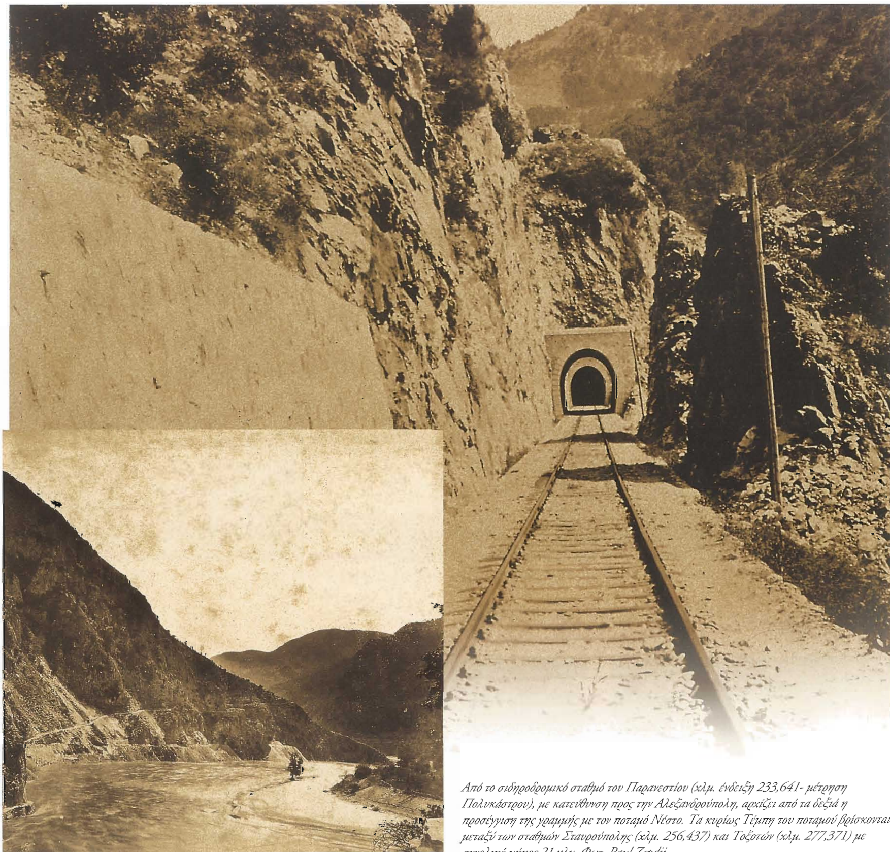
Από το σιδηροδρομικό σταθμό του Παρανεστίου (χλμ. ένδειξη 233,641- μέτρηση Πολυκάστρου), με κατεύθυνση προς την Αλεξανδρούπολη, αρχίζει από τα δεξιά η προσέγγιση της γραμμής με τον ποταμό Νέστο. Τα κυρίως Τέμπεη του ποταμού βρίσκονται μεταξύ των σταθμών Σταυρούπολης (χλμ. 256,437) και Τοξοτών (χλμ. 277,371) με συνολικό μήκος 21 χλμ.