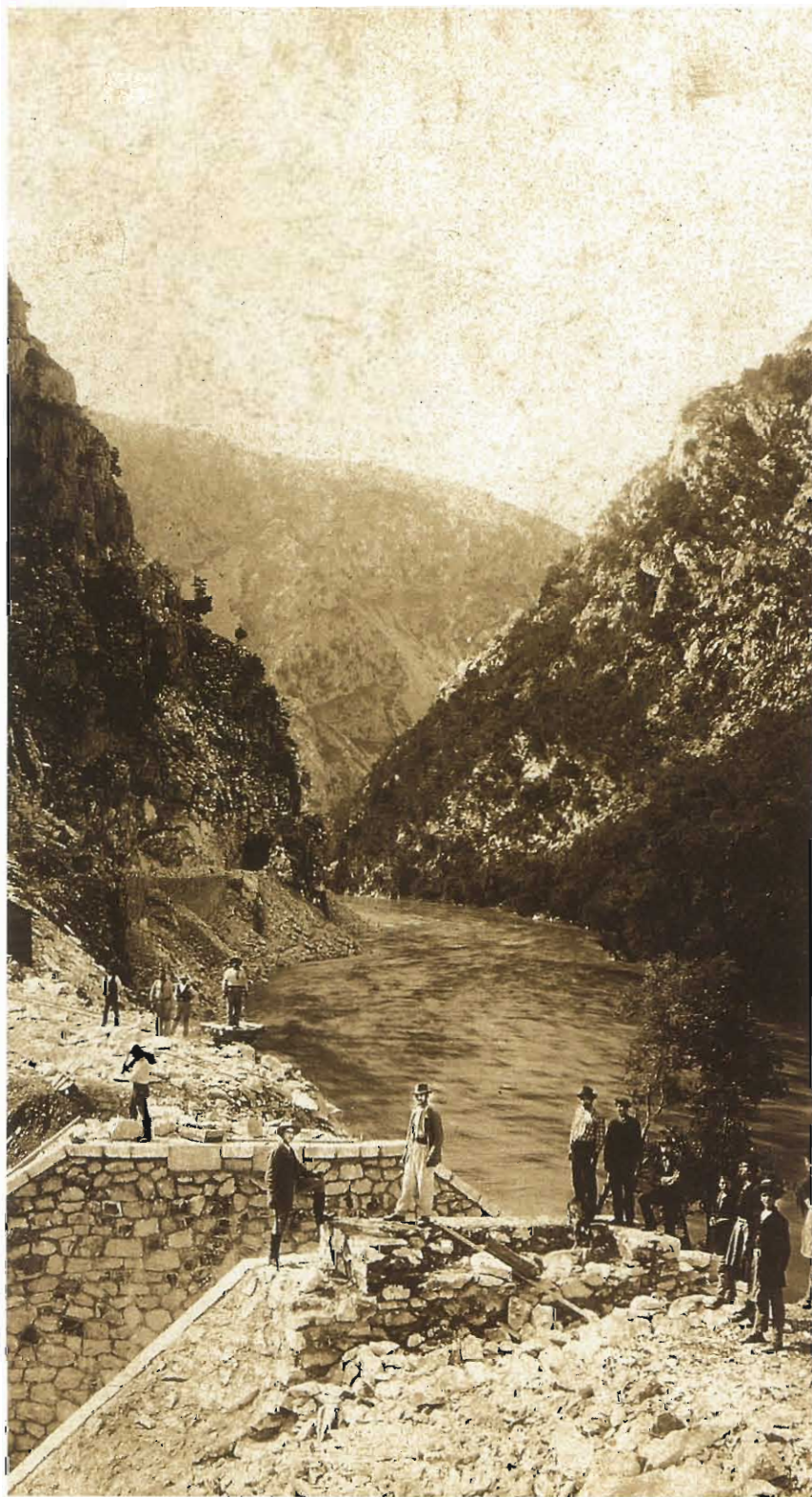
Τα βάνθρα της γέφυρας έτοιμα για την τοποθέτηση του μεταλλικού ζευκτού.