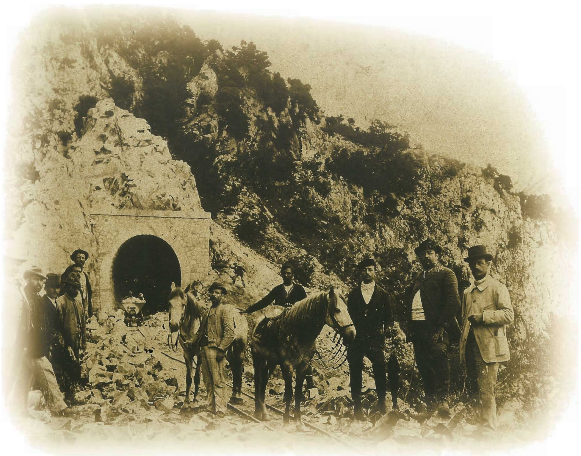
Τα απαραίτητα κεφάλαια καθώς και το τεχνικό προσωπικό για την εκτέλεση των σιδηροδρομικών κατασκευών προερχόταν από τις ξένες δυνάμεις, οι οποίες παραδοσιακά ασκούσαν την επιρροή τους στην Οθωμανική Αυτοκρατορία. Διακριτικό των Ευρωπαίων αποτελούσε η ενδυμασία τους καθώς και το ότι έφεραν τον ευρωπαϊκό τίτλο.