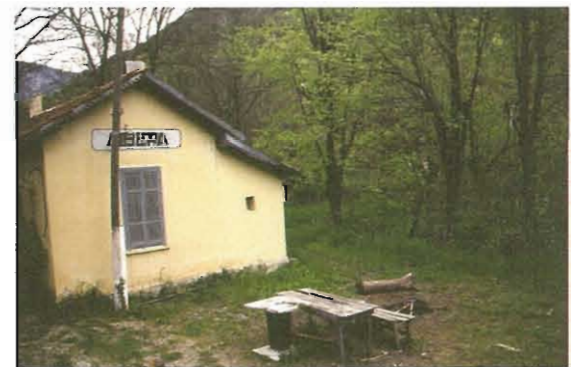
Ο σιδηροδρομικός σταθμός Λιβερών