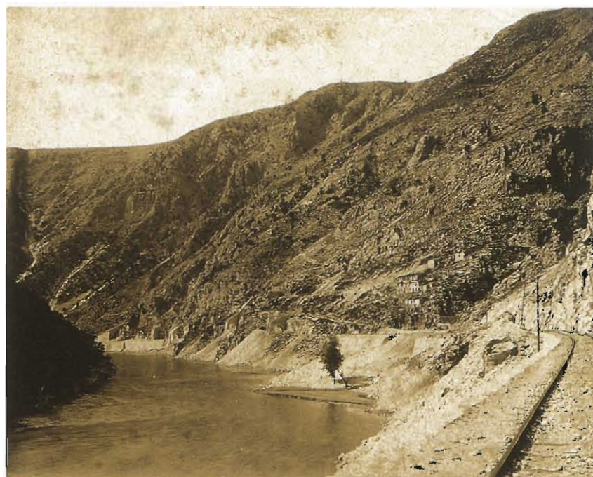
Η σιδηροδρομική γραμμή διασχίζοντας τα στενά του ποταμού με κατεύθυνση τη Δράμα.