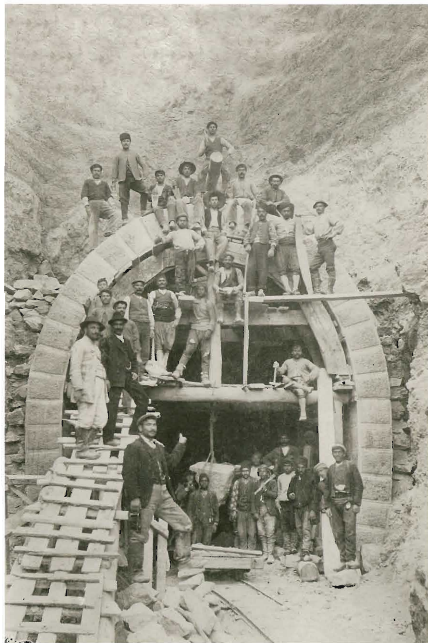
Εργασίες σφραγιστικής στο τμήμα γραμμής των στενών του Νέστου στη φάση κατασκευής των τόξων της προσωρινής υποστήλωσης για την επένδυση του θόλου της σήραγγας.