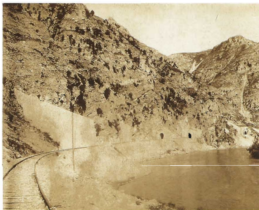
Η σιδηροδρομική γραμμή διασχίζοντας τα στενά του ποταμού με κατεύθυνση την Ξάνθη.