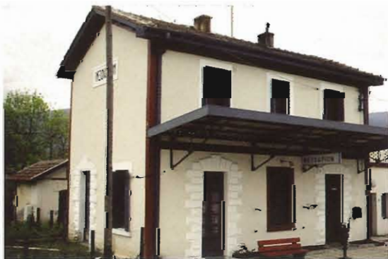
Σιδηροδρομικός σταθμός Νεοχωρίου.