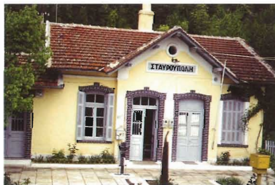
Σιδηροδρομικός σταθμός Σταυρούπολης